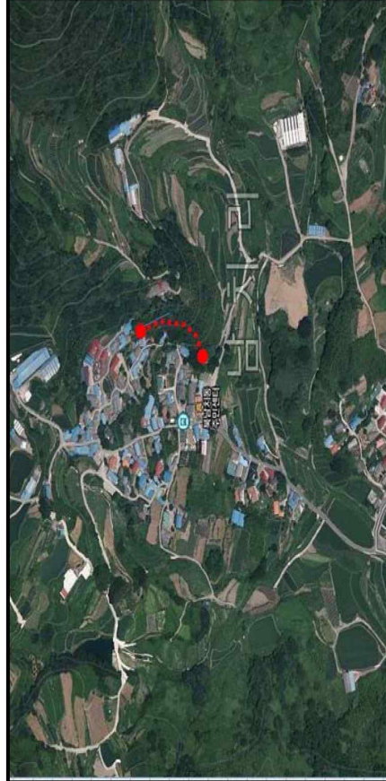
위 성 위 치 도