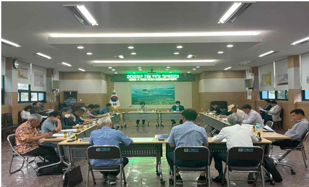
<7월 정례 이장회의>